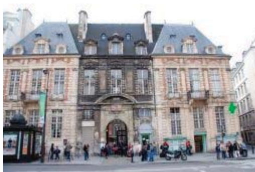
▲ Les Francs-Bourgeois Rue Saint-Antoine.

Ensemble scolaire créé en 1843 par les Frères des Ecoles Chrétiennes, l'école des Francs Bourgeois est un établissement privé sous contrat d'association, aujourd'hui un ensemble mixte, comprenant des élèves du primaire au lycée, rassemblant à peu près 1500 familles (pour un total de 2000 élèves).