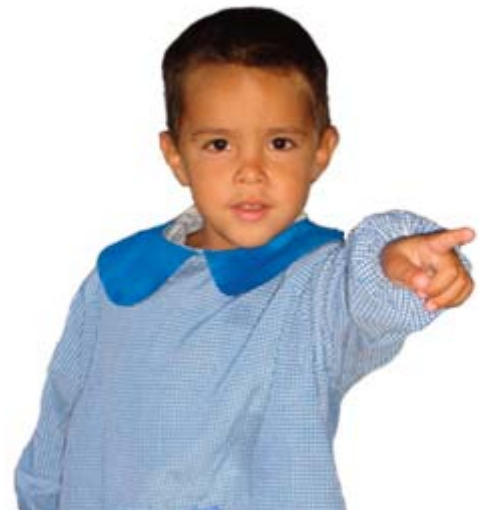
▲ Un habitant de Buenos Aires

Le projet Sémil (Service éducatif des missions internationales lasalliennes) 2008-2009, est le premier projet entrepris par les Francs-Bourgeois, et fait partie d'un ensemble de plusieurs dizaines de projets internationaux lancés au sein des écoles lasalliennes. Ce sont des projets définis sur le long terme permettant d'apporter aux populations locales l'aide et le soutien nécessaires.